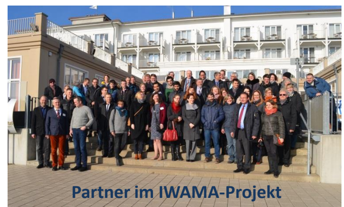
Partner im IWAMA-Projekt